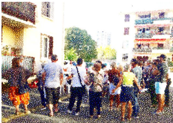
Photo café copro au pied de l'immeuble, dpt 13